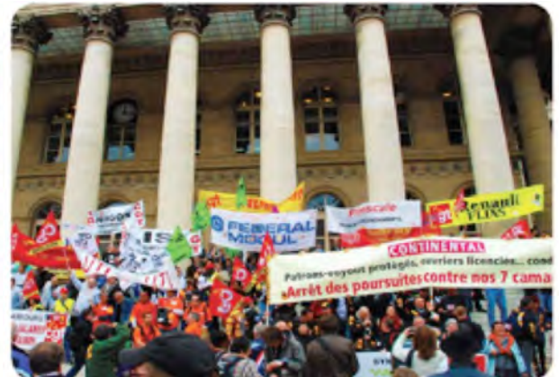
Etude des mouvements sociaux et des transformations économiques et sociales. Recherches classes ouvrières et populaires ; mouvements sociaux ; travail, interventions sociales.