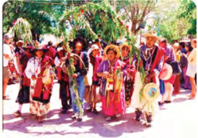
Amérique Latine, revendications identitaires, politiques multiculturelles – développement touristique.