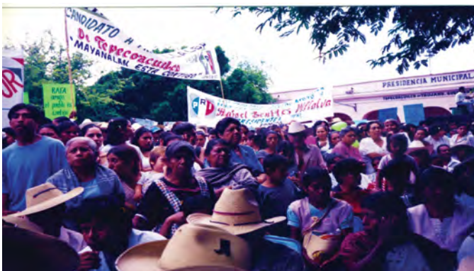
Formes du vote et pratique des assemblées, Mexique.