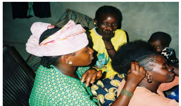
Genre ; migrations (Mali, France, Maroc) ; Afrique subsaharienne ; relations inter-ethniques.