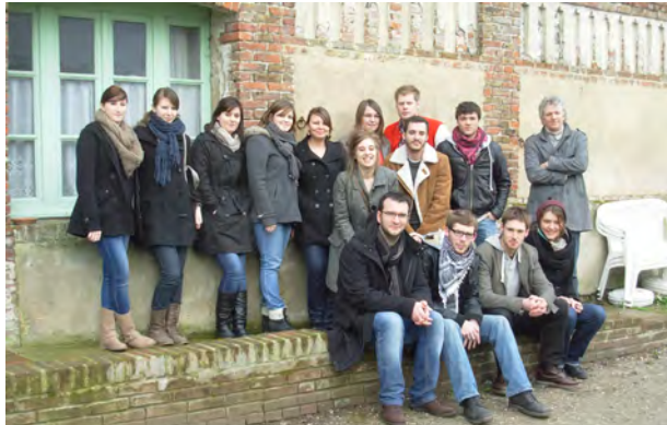
Stage de terrain L3 socio dans le Vimeux Enquête sur les conséquences sociales des transformations économiques