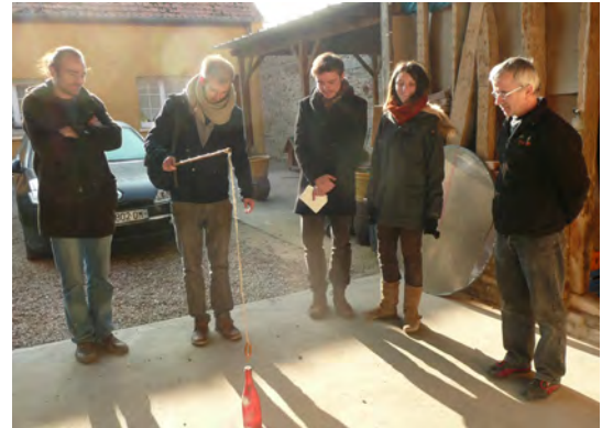
Stage de terrain des M2 recherche à Allonville (financement Amiens Métropole) Toutes les compétences sont mobilisées