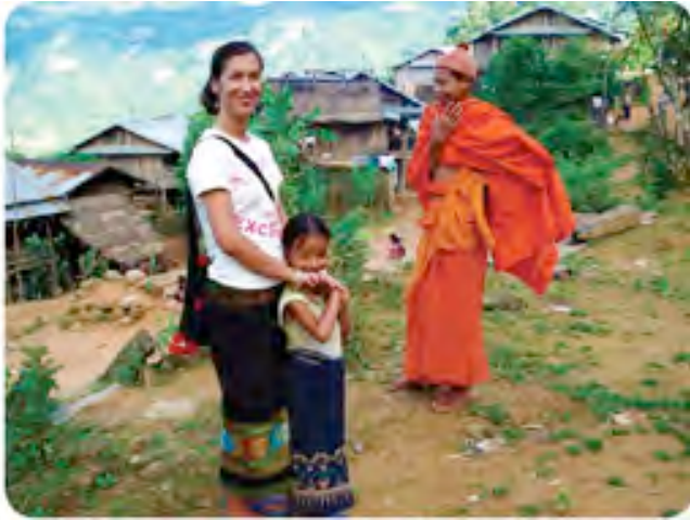
Asie du Sud-Est, minorités ethniques, mutations sociales, migrations.