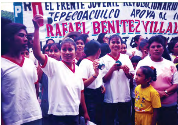
Anthropologie politique : campagne électorale en région inter-ethnique, Mexique.