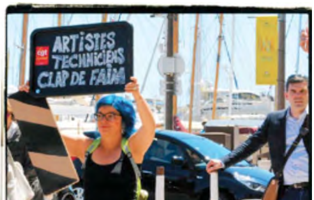
Sociologie de la culture – Sociologie du salariat et de la protection sociale. Sociologie historique. Artistes et professions intellectuelles.