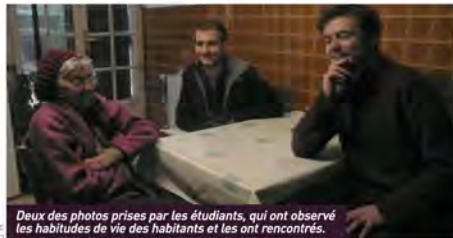
Deux des photos prises par les étudiants, qui ont observé les habitudes de vie des habitants et les ont rencontrés.

Six étudiants en sociologie de l'UPJV ont passé une semaine en "immersion" à Allonville. L'occasion de rencontrer les habitants de cette commune