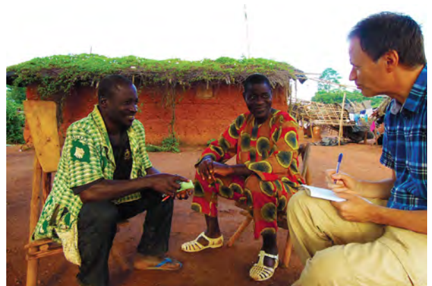
Démographie économique, démographie des Suds (Côte d'Ivoire, Burkina Faso, Ethiopie, Maroc). Migrations, rapports intergénérationnels, politiques de développement.