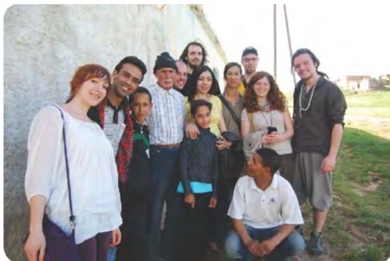
Stage de terrain L3 ethno au Maroc Mars 2011