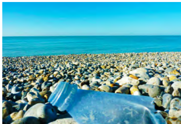
Etude sur l'impact des déchets sur les paysages – Sociologie des relations homme-nature. (Coordonné par D. Blot - Photo : J. Désert)