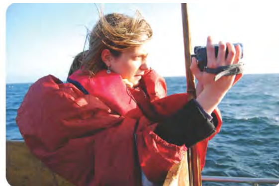
Stage de terrain L3 ethno à l'île d'Yeu Anthropologie visuelle, les étudiants doivent réaliser un film